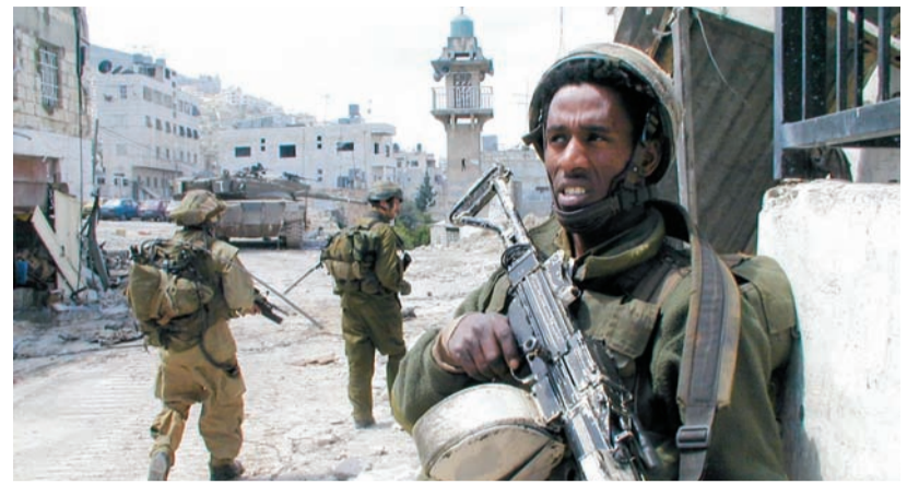
Израильская армия – это тот плавильный котел, который позволяет слоям еврейского общества «притереться» друг к другу